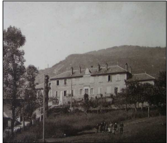
Mairie-école de Saint-Baldoph (1 er tiers 20 ème s.)

Le bâtiment, qui abritait alors aussi l'école, n'a pas été modifié. Seules les souches de cheminées, qui se dressaient sur le toit à l'origine, ont aujourd'hui disparu.