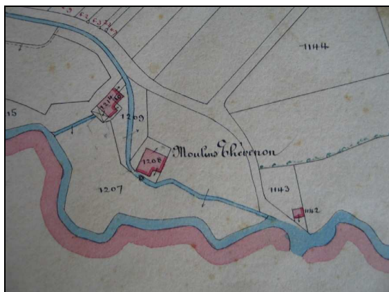
Extrait du cadastre napoléonien de 1915