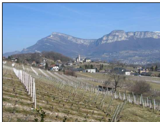
Vue sur le village du Mollard depuis les vignes

L'axe routier le plus à l'est, la route D201, constitue non seulement une voie d'accès à Saint-Baldoph, mais aussi une voie de passage traversante permettant de rejoindre Barberaz et Chambéry. Cette route, de création contemporaine, reprend le tracé de l'ancienne route d'Apremont à Barberaz.