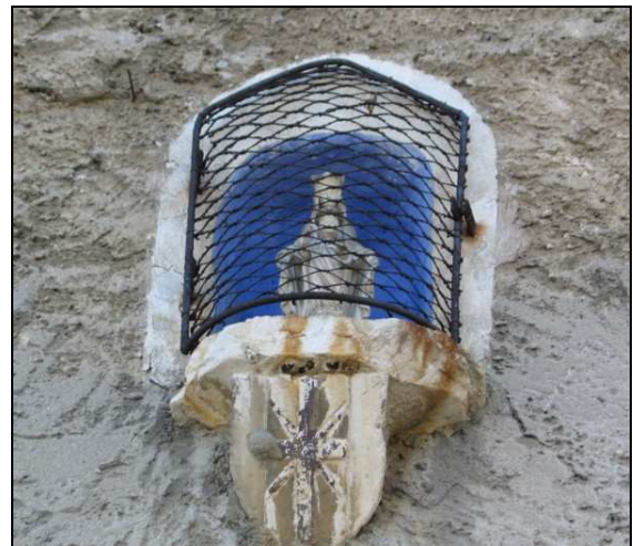
Niche abritant une Vierge ménagée dans une façade

Au 19 ème s. et durant la majeure partie du 20 ème s. (jusqu'au début des années 1980), des processions avaient lieu lors de fêtes religieuses. Elles passaient devant les croix mais aussi devant les nombreuses niches abritant une statuette de la Vierge, ménagées dans les façades des maisons.