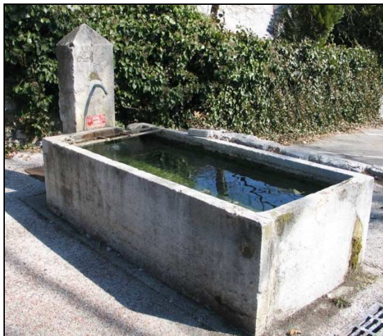
Fontaine dans le hameau de Musselin

A noter au hameau de Musselin, une fontaine dotée d'un bassin de grandes dimensions, faisant également office de lavoir.