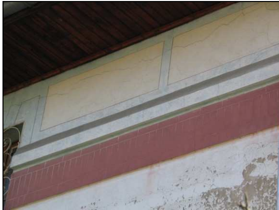
Décor peint sous la dépassée de toiture d'une maison

Une maison bourgeoise de la fin du 19 ème s. propose, quant à elle, un décor géométrique peint à la chaux (fond bleuté, rehauts rouges et cadres blancs), surmontant un bandeau rouge à décor de faux-appareil (briques), au niveau des ouvertures de l'étage et des chaînes d'angle. Un encadrement de fenêtre d'une maison rurale est peint d'un appareillage de fausses briques.